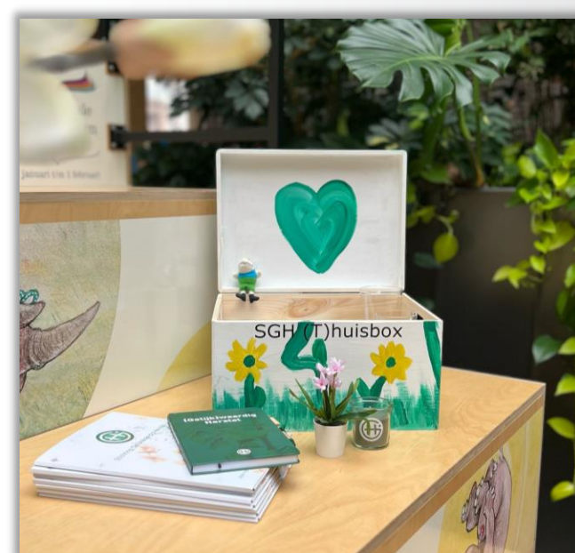
Op iedere SGH Luisterplek vind je een Thuisbox

Afspreken op een SGH Luisterplek? Klik hier!