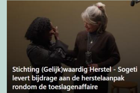
Stichting (Gelijk)waardig Herstel - Sogeti levert bijdrage aan de herstel aanpak rondom de toeslagenaffaire

eigen regie – vertrouwen - neutraliteit - collectiviteit