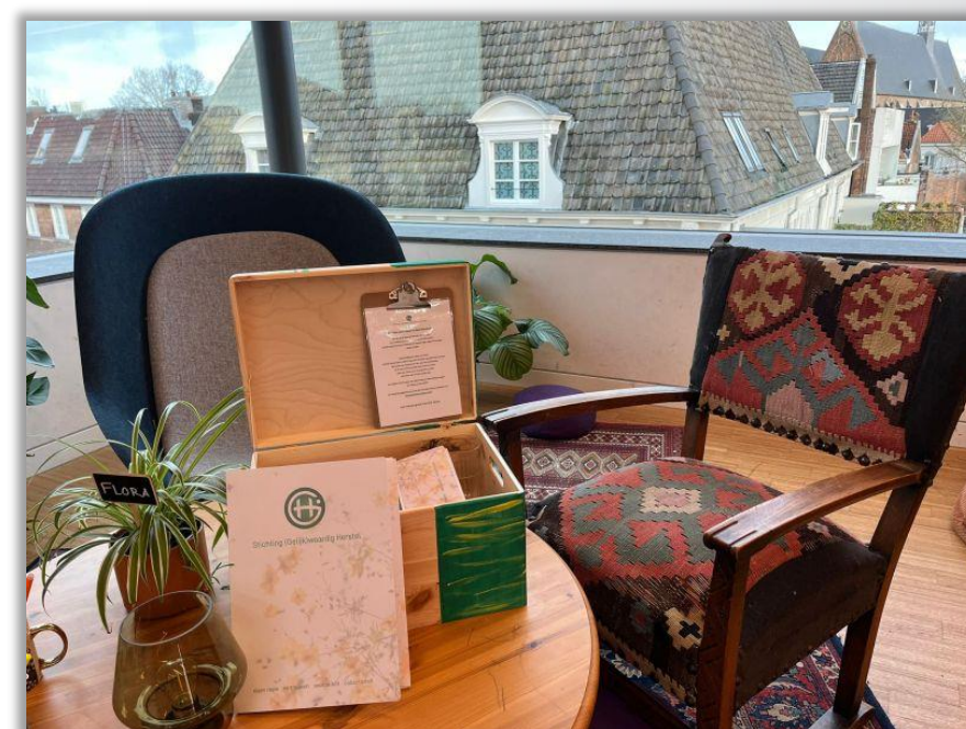
Op iedere SGH Luisterplek vind je een Thuisbox

Afspreken op een SGH Luisterplek ? Klik hier!