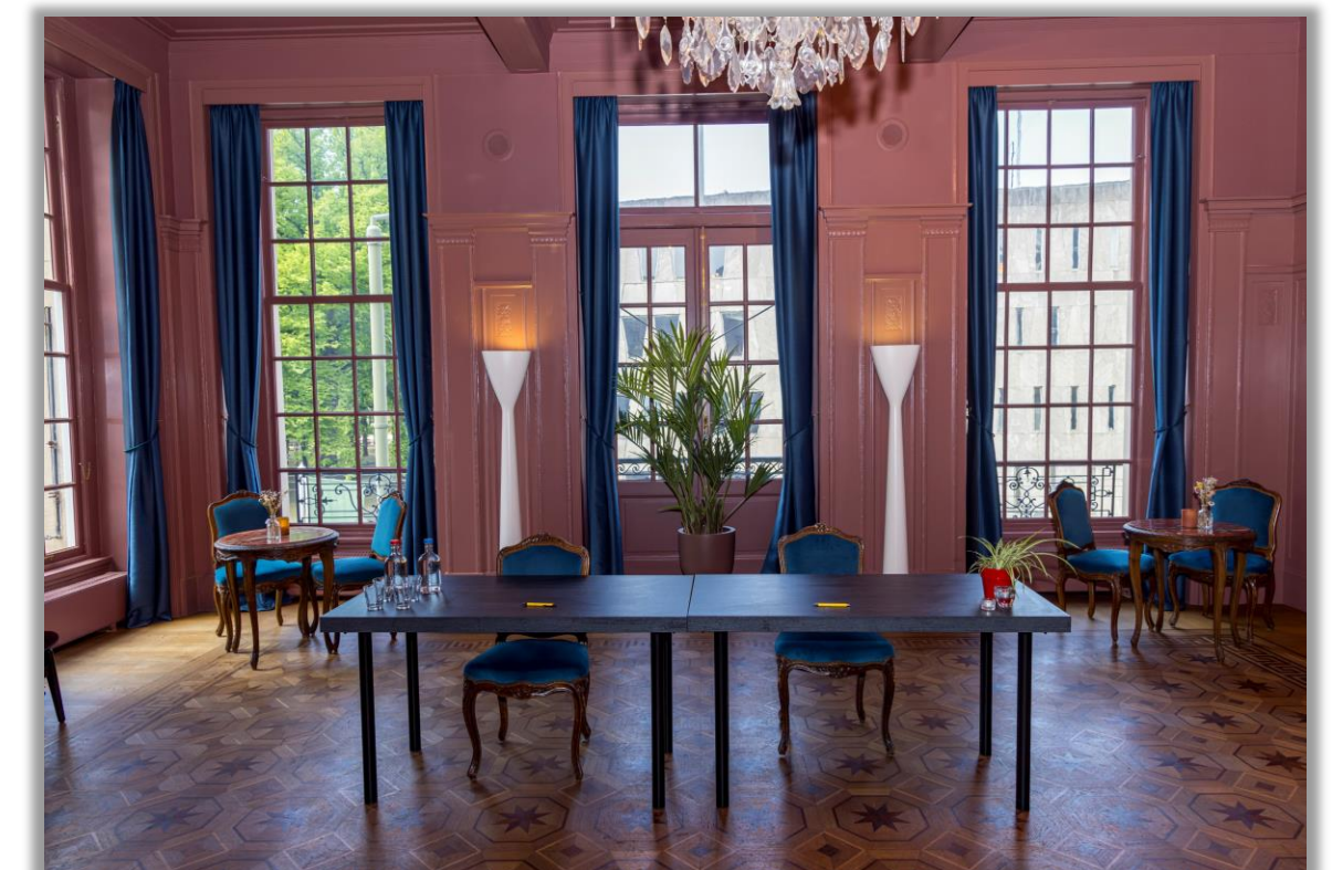
Tekencereemonie in de Koninklijke Schouwburg Den Haag