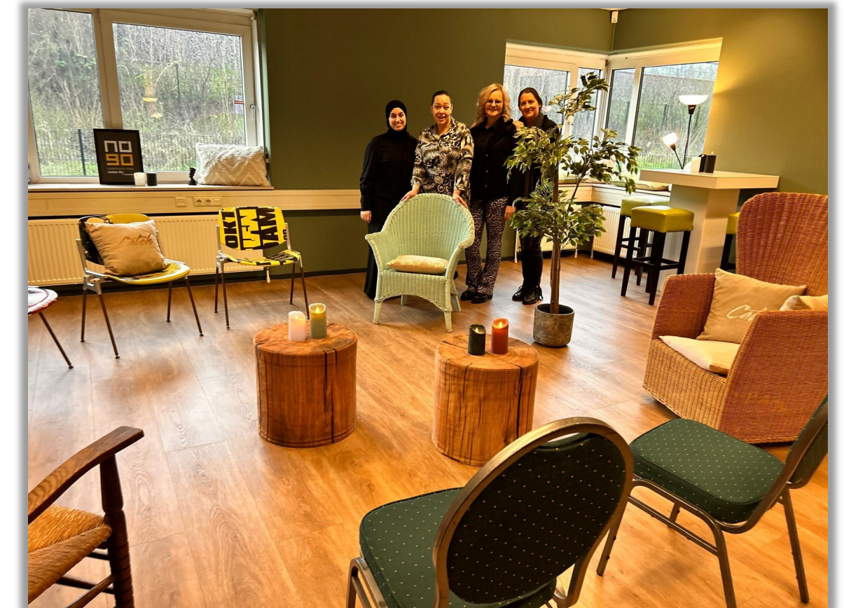
Tekencereemonie bij nummer 90 in Almere

→ We zijn voor 'Vindplaatsen' en de ouders waar zij mee in verbinding staan ook Digitale Informatiebijeenkomsten aan het voorbereiden. Denk bijvoorbeeld aan advocaten, Ondersteuningsteam Buitenland en gemeenten.