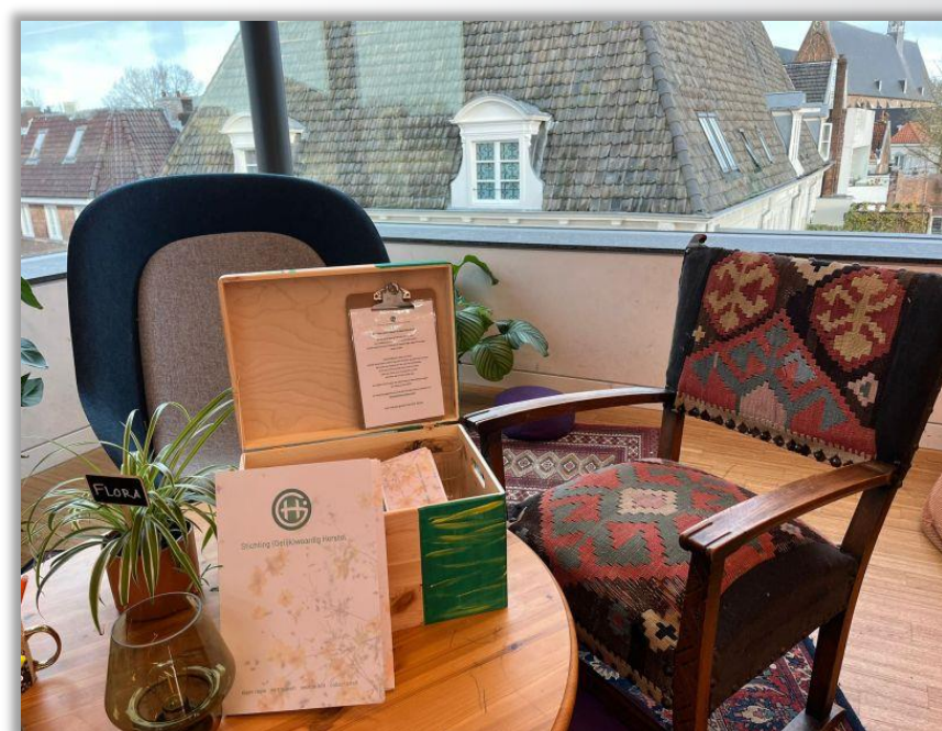
Op iedere SGH Luisterplek vind je een Thuisbox

Afspreken op een SGH Luisterplek? Klik hier!